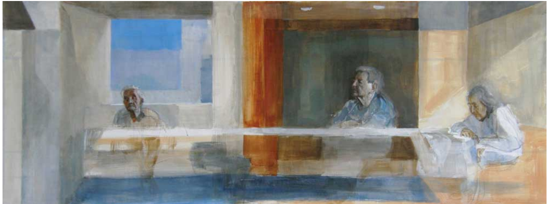
ontwerp bij eindpresentatie (voor een wand van 700cm bij 275).

De buitenwereld is niet het enige wat voor hen moeilijk wordt om te bevatten. Het verval gaat bij iedereen weer anders. Maar uiteindelijk leidt het afnemen van het geheugen en andere geestelijke vermogens tot een onverbiddelijk isolement. Zelfs het eigen lichaam luistert niet meer. Qua levensbehoeften trekt men zich steeds meer terug, tot uiteindelijk het hoogstnoodzakelijke (veiligheid, voedsel en rust). Wij kunnen nog op dit karige niveau enig contact hebben. Maar het is alsof zij zich in een aquarium bevinden waarvan het glas dikker en ondoorzichtiger wordt, en het water troebeler en donkerder, tot wij nog slechts een schim kunnen ontwaren van de mensen die wij eens hebben gekend. Omgekeerd zie je ze soms verwoede pogingen ondernemen 'naar buiten' te komen. Maar ze komen hoogstens 'tot aan het glas'.