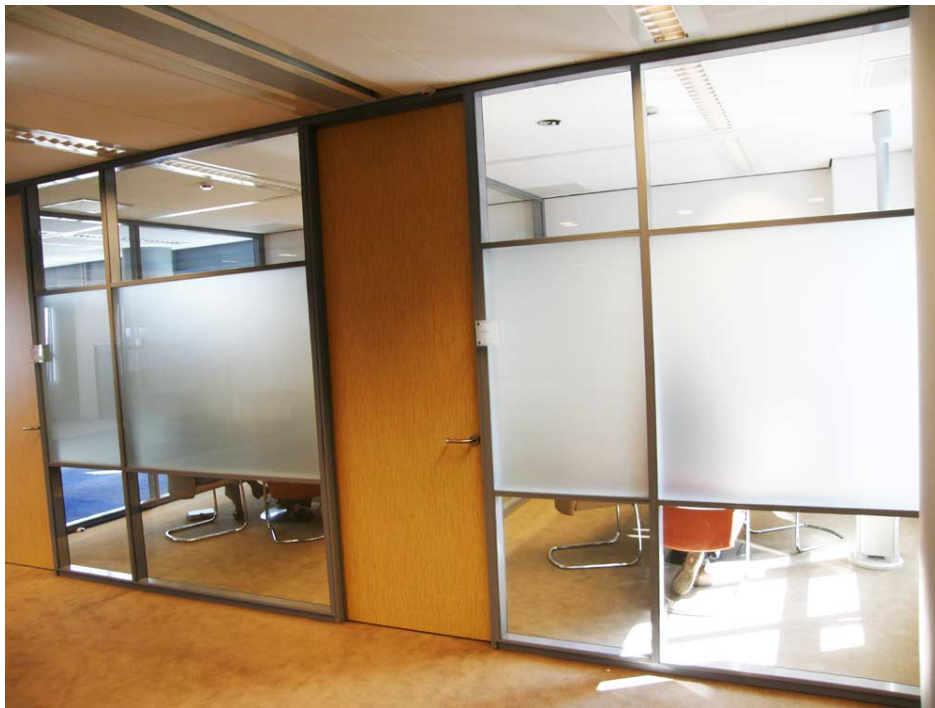
(glaswand. Als raster voor een schildering moet je het kozijn voorstellen zonder glas)

Voor alle wandschilderingen kon ik het kantoor zelf gebruiken om een structuur, een basis te leggen voor mijn hele afbeelding. Dat zou de visuele eenheid hebben gebracht die nodig is tussen de verschillende thema's.