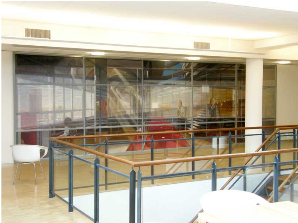
(het schilderij ter plaatste in het hoofdkantoor van Achmea Zorg in Zwolle)