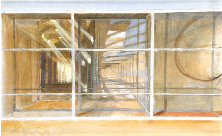
(een voorbeeld van associatieve invulling van de verder in het gebouw liggende ruimte)

In deze schets heb ik het volgende geprobeerd. De eerste ruimte die zichtbaar is achter de 'glazen wand', is een smalle gang met weer zo'n zelfde wand. Alle delen zijn doorzichtig, maar nadere beschouwing laat zien dat alle compartimenten gesloten zijn. Een liftdeur links komt uit op een ruimte van enkele vierkante meters. Ernaast gelegen een ruimte die onbetreedbaar is. Erachter meer dezelfde ruimtes, die door spiegeling en verandering van ruimte moeilijker te volgen zijn. Maar wel duidelijk is het volgende: meer naar achter wordt het gebouw ouder, en anders. Patiënten bevinden zich in deze ruimten. Zijn het hun associaties, hun herinneringen geprojecteerd in de spiegelingen?