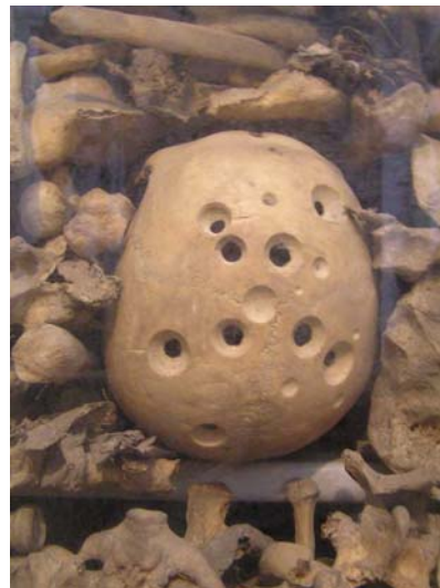
(het licht door gaten in het dak van deze iraanse bazaar gaf mij een puur persoonlijke associatie met de vreemde gaten in een schedel die ik zag in een crypte in Otranto. Voor mij een zinnebeeld van Alzheimer.)