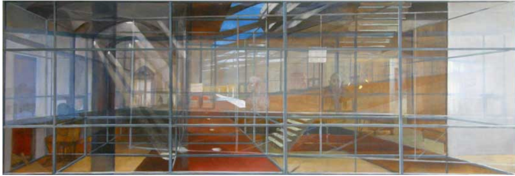
(ontwerp voor eindpresentatie)

In een later stadium werd besloten om alleen dit ontwerp, “de verwarrende wereld, versnippering van ruimte en tijd”, uit te voeren. Hieronder het ontwerp van de eindpresentatie en ter plaatse in het restaurant. Voor het eindresultaat zie de foto op de website, onder: dementieproject.