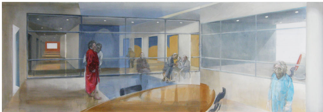
(ontwerp bij eindpresentatie van verpleeghuisafdelingen zogenaamd achter de 'glazen kantoorwand', rond 900cm bij 275cm. Onder: voorbeeld van een invulling met bewoners)